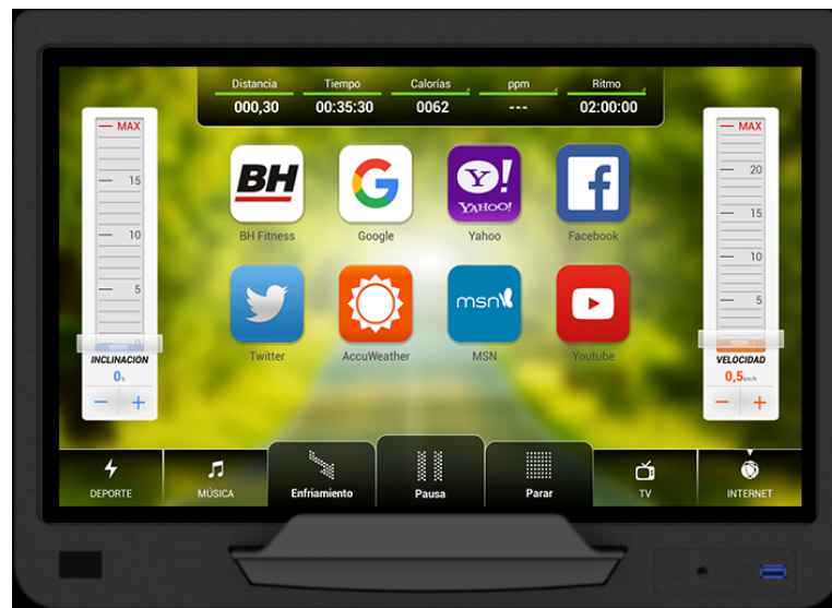
DISPLAY MIT VOLLER KONNEKTIVITÄT (SMARTFOCUS)